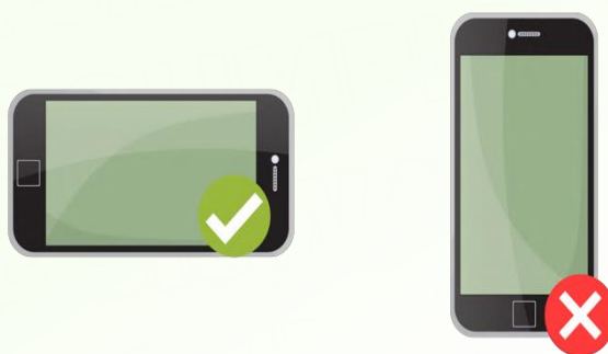
Gambar 2. Posisi kamera/HP saat pengambilan video (gambar)